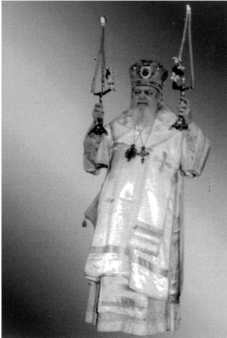
Ὁ ἅγιος Ἐπίσκοπος Λουκᾶς Ἱερουζῶν.