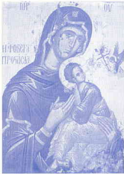
Θαυματοργός εικόν Η ΦΟΒΕΡΑ ΠΡΟΣΤΑΣΙΑ τῆς Ἱερᾶς Μονῆς Κουτλουμουσίου.